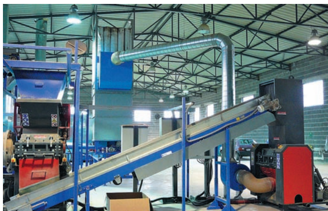
Drcení materiálu v drtičích s hrubým a jemným sítem