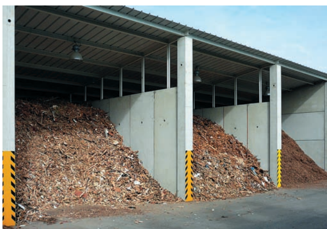
Materiál je uskladněn v boxech pod přístřeškem

CASTOR_600 se sítím 20 až 30 mm. Zde je materiál drcen na jemnější, ale stále pro briketování hrubou frakci, která vypadává na pásový dopravník s další magnetickou separací. Vyseparovaný materiál je vyhrnován do přistavené nádoby. Hrubá frakce po separaci je pásovým dopravníkem dopravována do dalšího stupně drce-