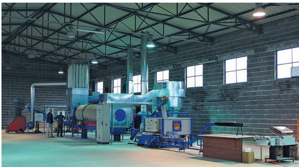
Technologická linka BRISUR na zpracování pilin briketováním

Předmětem dodávky byla výroba a instalace technologické linky, její uvedení do provozu, odzkoušení a zaškolení obsluhy. Stavbu včetně přívodu vody a odpadní kanalizace, přívody elektroinstalace zajišťoval investor vlastními silami.