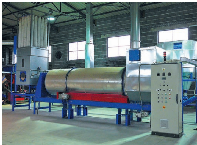
Sušárna BUS vysuší materiál až na 12% vlhkosti